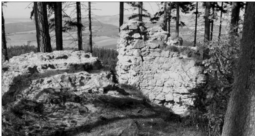
Zříceniny hlavní věže a štítové zdi Střileckého hradu