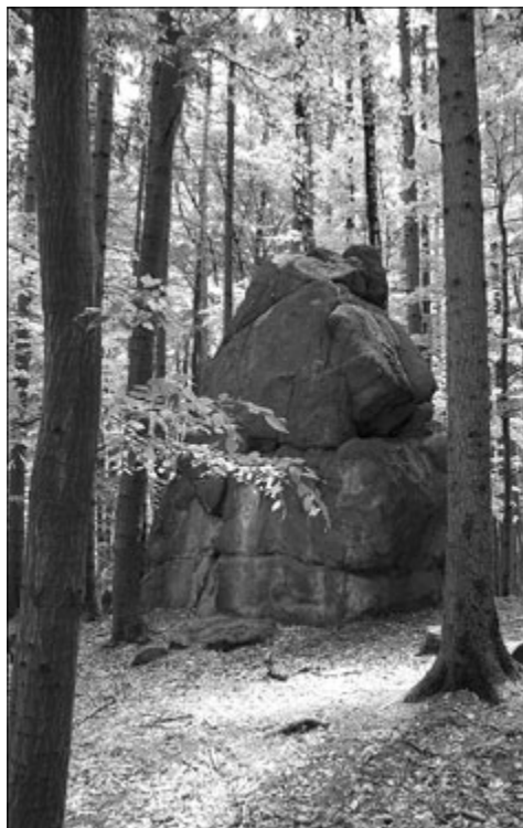
Skalnatý útvar při cestě

mohou v návštěvnických vyvolávat různé představy. V jednom z kamenů se nachází vícero zaoblených otvorů, v nichž prý bývá slyšet šumění podzemní vody. Při troše štěstí a díky odlehlosti místa můžete uslyšet tento vjem i vy. Pod jiným z balvanů má být zase vchod do podzemního bludiště, o němž ve starých časech vypravovali starousedlíci.