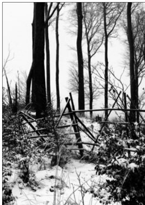
Zima na Holém kopci

smrdátka – Smraďavka sosák – hanlivě nos sotúrek – taška na nošení svačiny sršáň – sršeň starý syr – sýr stlúkat – dělat máslo v maslince (máselnici) střapec – plod vinné révy střechyl – rampouch – zmrzlý led visící ze střechy bez rýny státy – opilý namol, úplně, je ožralý jak Cepelín (zeppelin) suliběta – pomalá žena, nešika sumírovat – dávat dohromady; přemýšlet súsed – soused svat – tchán (zeťův, snašín otec) syr – tvaroh šamrla – stolička pod nohy šatlava – obecní vězení pro provinilce šenkýř – kdo čepuje pivo v šenku v hospodě Milán Janovský