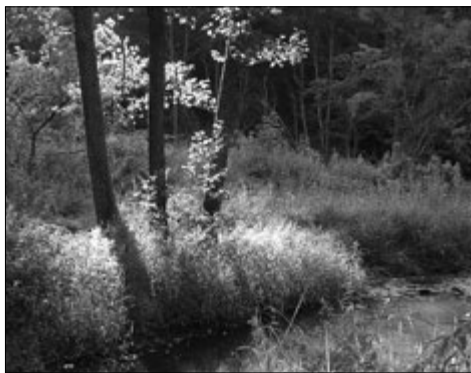
U řeky Úhlavky