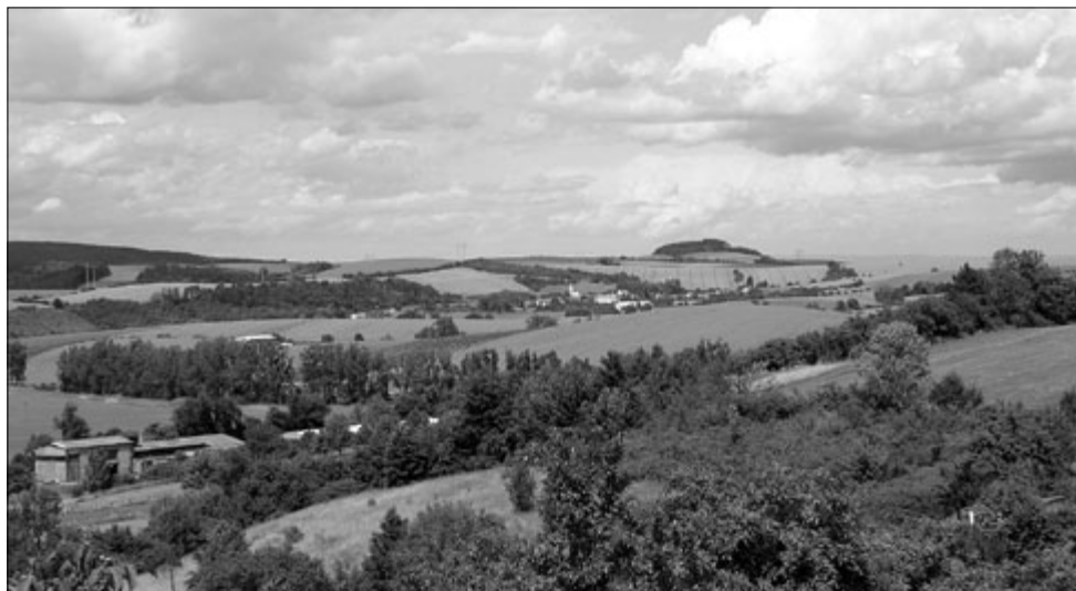
Střílečká krajina s dominantním Chlumem nad Cetechovicemi

s Ježíškem v lidovém podání. Naše pouť pokračuje ke zbytkům zříceniny Střílečského hradu, rozléhající se v nadmořské výšce 552 m, jenž býval v době své existence nejrozsáhlejším a podle pozůstatků i nejlépe opevněným hradem Maršovských hor – dnešních Chřibů.