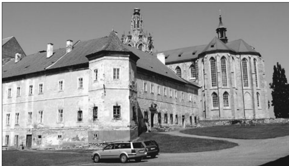
Nádvoří kláštera v Kladrubech

V následujícím století dochází k hospodářskému i náboženskému rozmachu kláštera, vznikají nové budovy, hospodářské zázemí a dvory se zahradami. Součástí kláštera se stal i pivovar a škola. Konec vzestupu Kladrub nastal příchodem třicetileté války. Po válce jsou klášterní objekty dále rozšiřovány, ale vrcholem zvelebování kláštera byl nástup opata Maura Fintzguta počátkem 18. století. Podle návrhů architekta Jana Blažeje Santiniho-Aichla byl klášterní kostel v letech 1711–1726 přestavěn