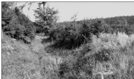
Dochovaný příkop Střileckého hradu

Značenou trasou se zanedlouho dostáváte na hřeben kopců, táhnoucích se od motores-tu Samoty či Bumbálky ke Koryčanům. Tamní křížovatka značených turistických cest nese název U Zeleného obrázku. Obrázek tu koneckonců můžete spatřit na kmeni vzrostlého modříny dodnes. Zobrazuje sedící Pannu Marii