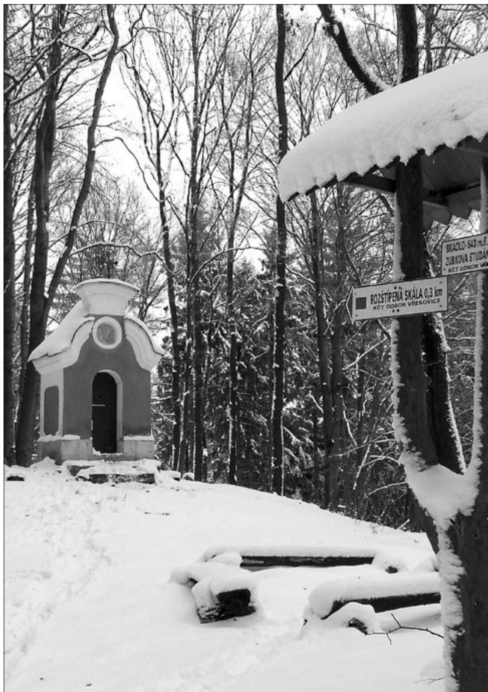
Výšlap ke Koryčanské kapli pod skalnatým hřebenem Bradla zanechá ve výletnicích pěkný zážitek i v zimním období.