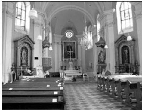
Interiér stříleckého kostela

Úvodní panel naučné stezky najdete v blízkosti zdejšího farního kostela, zasvěceného Nanebevzetí Panny Marie, honosné dominantní barokní budovy významného architekta Mořice Grimma, založeného na místě starého svatostánku roku 1728. Nejprve horní část