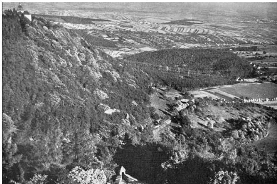
Barborka a Buchlov na fotografiích z roku 1943 (uveřejněno v nacistické propagandistické publikaci Das Böhmen und Mähren – Buch).