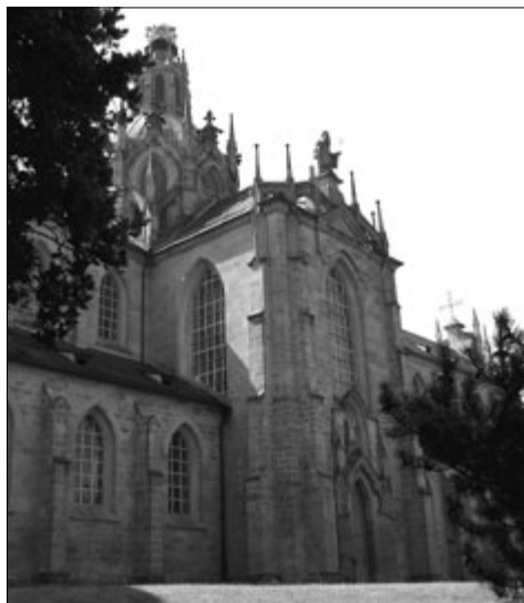
Průčelí kladrubského chrámu