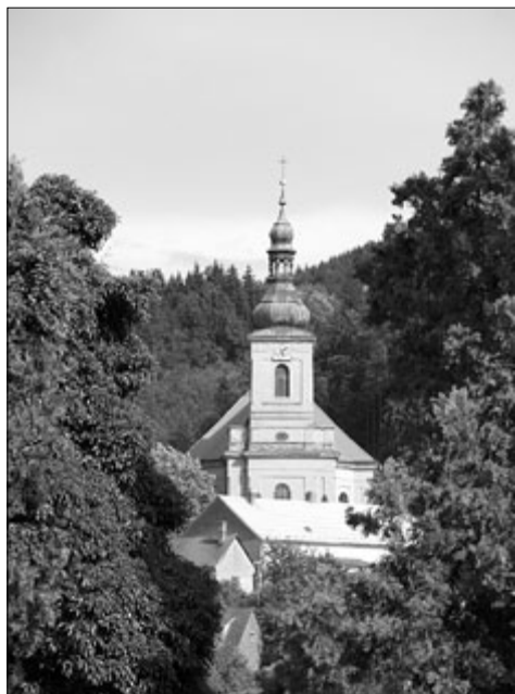
Kostel ve Střílkách

Přijměte tentokrát pozvání na Střílecko, do blízké chřibské oblasti, která ještě není zdaleka tolik zatížena komerčním cestovním ruchem, jako je tomu například v našem nejbližším okolí. I proto a o to více už na první pohled působí klidněji a její návštěva pro vás může být, jak se říká, přívětivým pohlazením na duši. Pokud máte zájem o historii a přírodní zajímavosti, můžete využít nabídky zdejší sedmikilometrové naučné stezky „Příroda a okolí Střílek“, jež nedávno vznikla díky nadšeným stříleckým patriotům, pod záštitou obce Střílek a Zlínského kraje. Jednotlivá zastavení s informačními panely jsou v péči střílecké základní a mateřské školy, zastoupené obětavou paní ředitelkou, Mgr. Ludmilou Ludvouou.