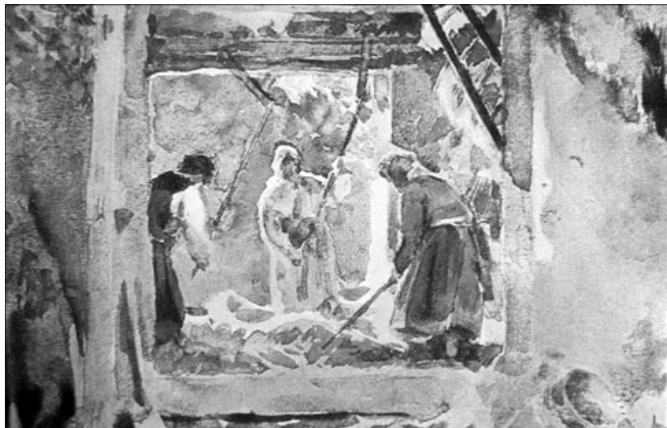
Mláčení obilí cepy na dobové ilustraci