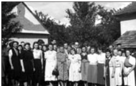
Buchlovické sokolky ve 40. letech