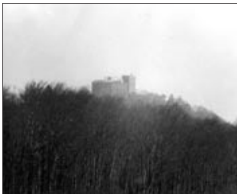
Buchlov od západu

ky). Na tomto kopci stával podle některých pramenů chrám již v době pohanské a byl vystavěn tajemným kmenem Pagánů, našich prapraprapředků. Toto dokládá do skaliska na východní straně vrcholu hory vytesaná psi hlava. Pozdější Moravané tento pohanský chrám přebudovali na křesťanský. Pod Hroby se nacházela ovocná arcibiskupská zahrada, se kterou sousedilo velké pole v oblasti dnešní Pánovy louky a Kršlí. Pod Kršlemi ze strany k Holému kopci stával další kostelík. Místo je dodnes staršími občany zvané Kostelík. Nedaleko je také kopec Ocásek. I zde stával v dobách staré Moravy hrad, a ne ledajaký. Jednalo se o shromážděné vladyků a soudců, král na tento hrad svolával všechny důležité poradní schůze. Do dnešních dob se na Ocásku zachovalo jen pramálo památek. Několik povalených balvanů a jeden tesaný, zasazený do země nese starý nápis K. V., což znamená Královský Velehrad, neboli Královský velký hrad. Podobné kameny s nápisem K. V. byly nalezeny na Strílkách, Brdě i na Holém kopci. Na Ocásku byl však nápis nejvíce patrný.