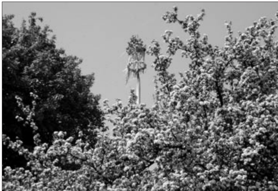
Rozkvetlé stromy k jaru neodmyslitelně patří.