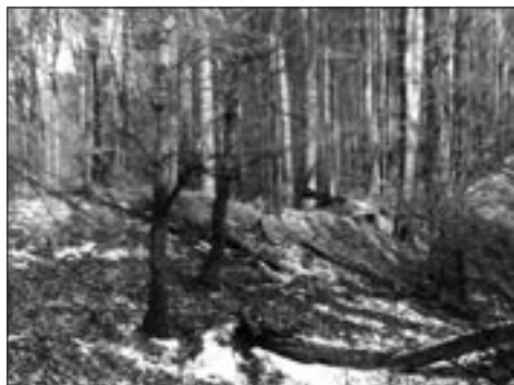
Val na Holém kopci

pluk zase jiný, musíme říct, že Děvín, neboli dnes Buchlov, byl sídlem moravských panovníků. Dle prokazatelných důkazů pochází z doby slavného Svatopluka nejmohutnější buchlovská věž zvaná Západní. K nejvýznamnějším a také nejlépe zachovaným památkám z doby staré Moravy patří hradisko Klimentek u Osvětiman se základy kostela svatého Klimenta. Další památkou je Holý kopec, dříve zvaný Bouda či Kamenná bouda. Holý