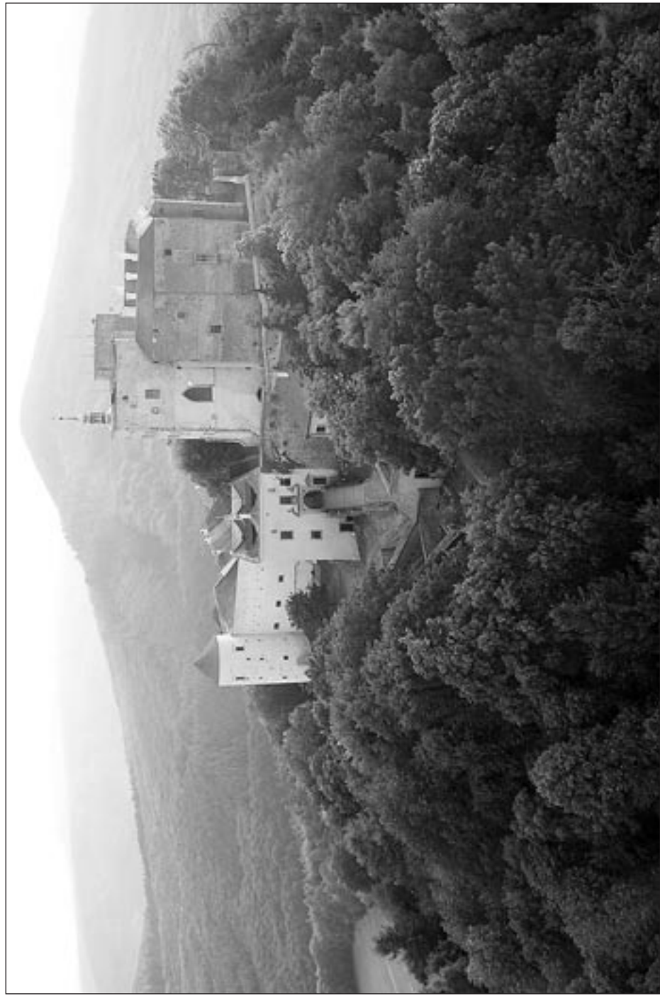
Pohled na Buchlov z balonu