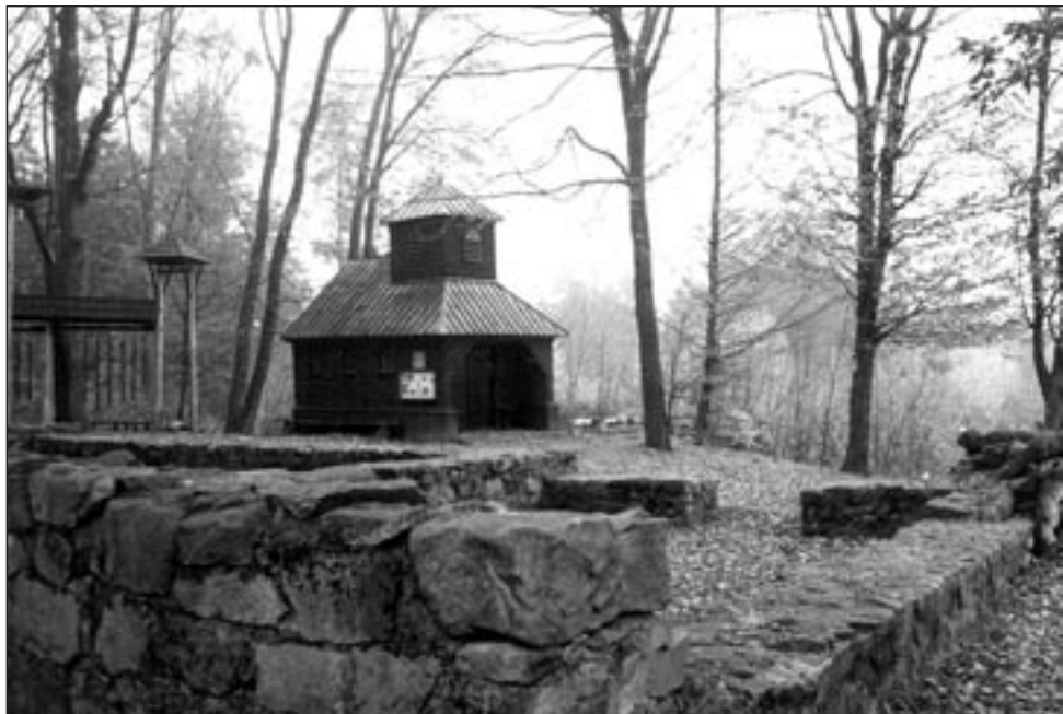
Vrchol svatoklimentské hory