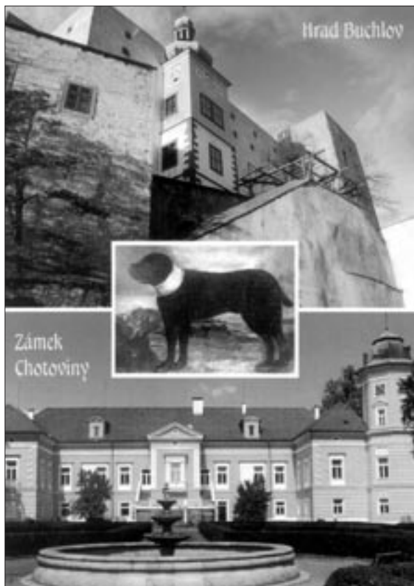
Nová pohlednice se psem Cerberem, s hradem Buchlovem a zámkem v Chotovinách je v prodeji na informačním centru v Buchlovicích

Naše krajaň z USA, Kanady, Austrálie a Nového Zélandu inspirovaly naše články k návštěvě