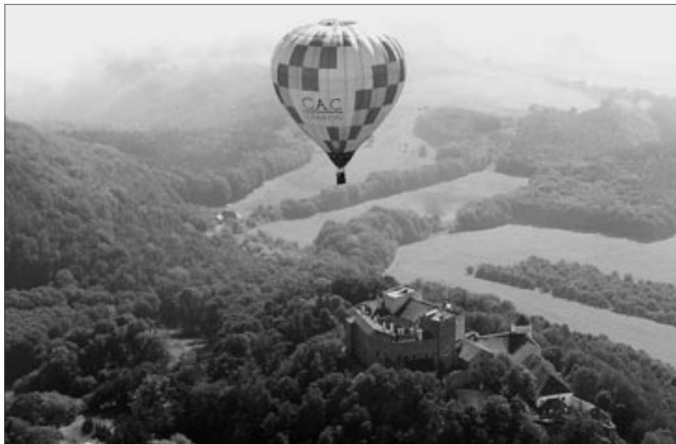
Fotografie z balonu nad Buchlovem a Barborkou