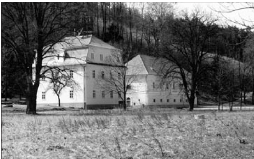
Lázně Leopoldov v dubnu 1995