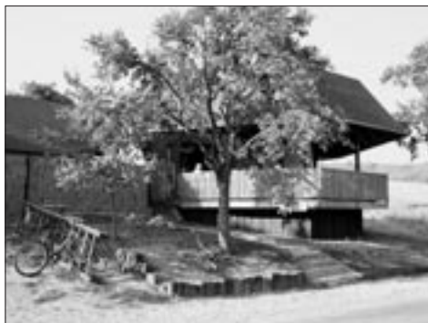
Nová hospůdka U křížku

Vydařený podzim je jako stvořený na vycházku, a proto vám chceme nabídnout námět na malý výlet do okolí našeho městečka. Můžeme se na něj vydat buď pěšky nebo na kole.