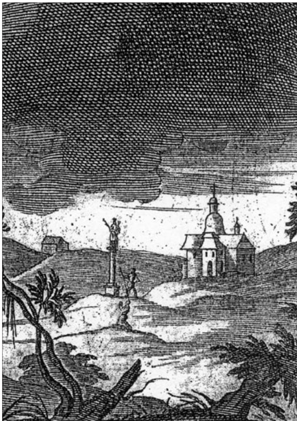
Rytina kaple sv. Barbory (výřez) z roku 1719