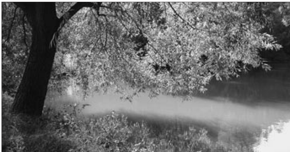
Rybníček na Smraďavce