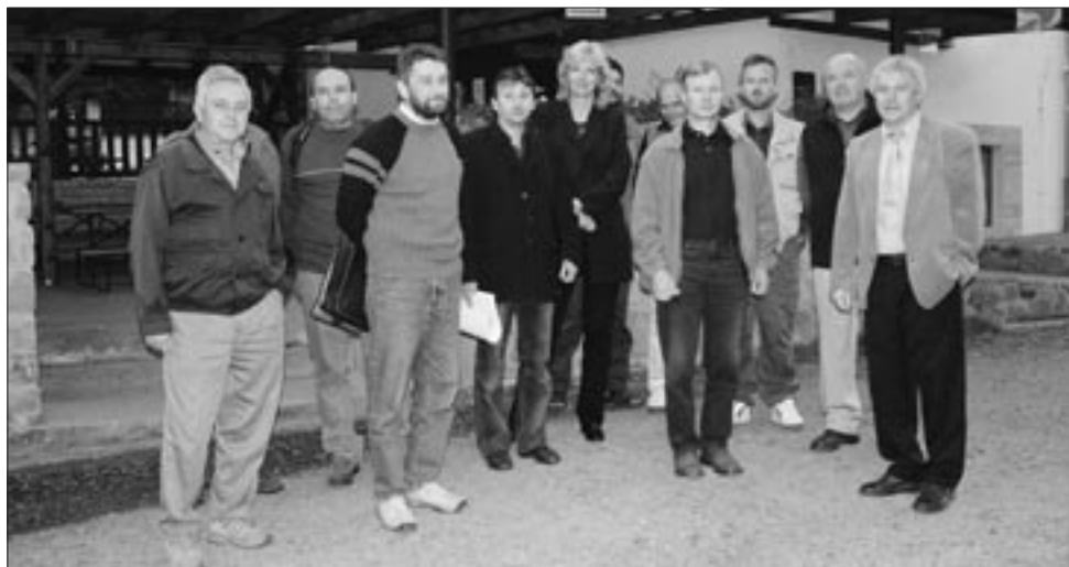
Po skončení veřejného zasedání v úterý 21.9.2004 si členové obecního zastupitelstva prohlédli opravené prostory autokempu na Smraďavce