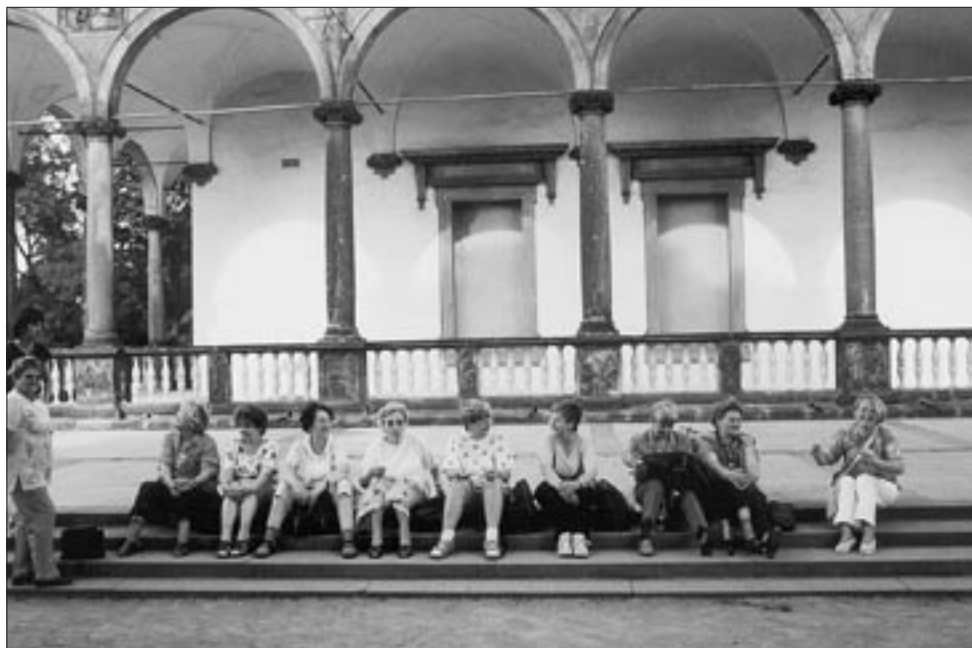
U letohrádku královny Anny