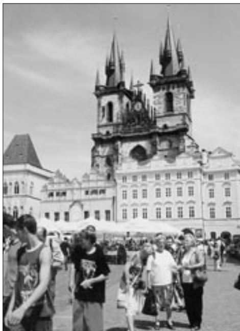
Na Staroměstském náměstí