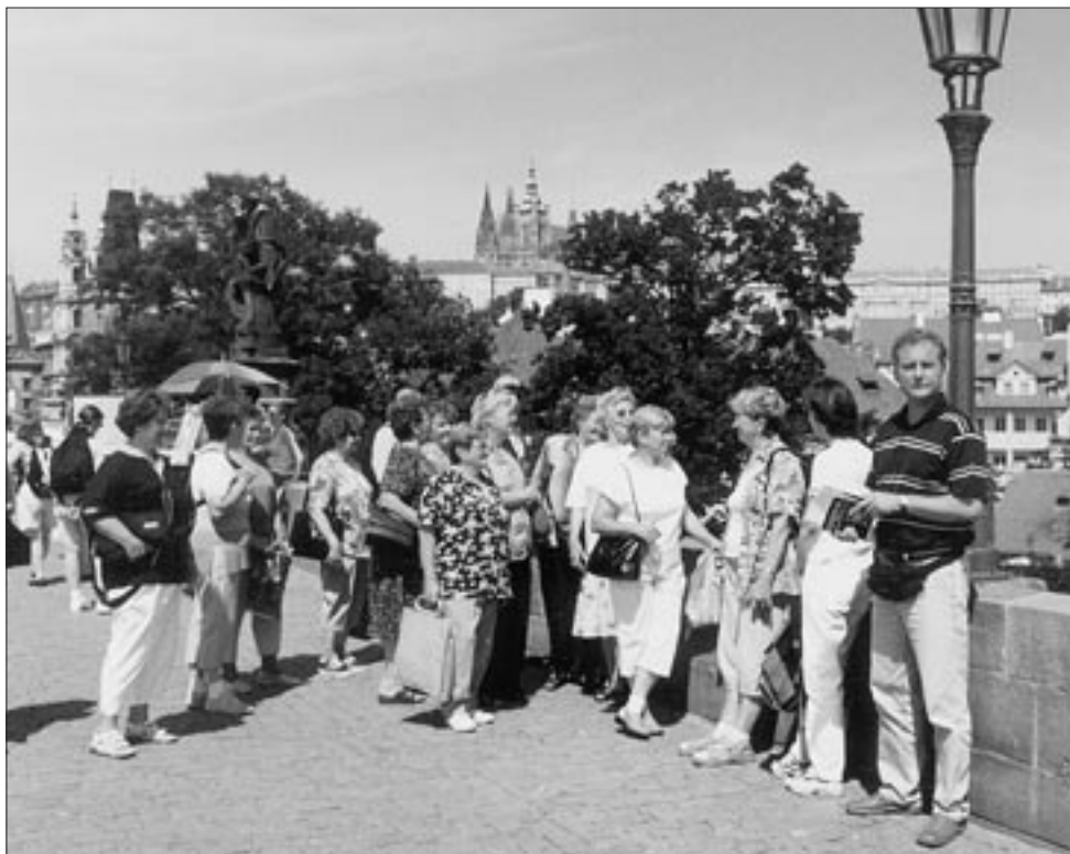
Členové sboru na Karlově mostě