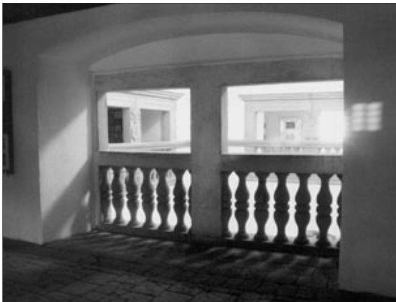
Interiér horní části kaple