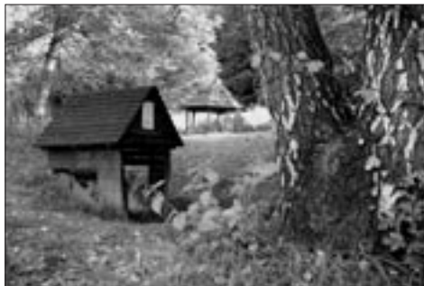
U bývalé Šanderovy hájenky