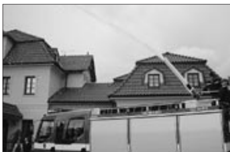
Nové auto v akci