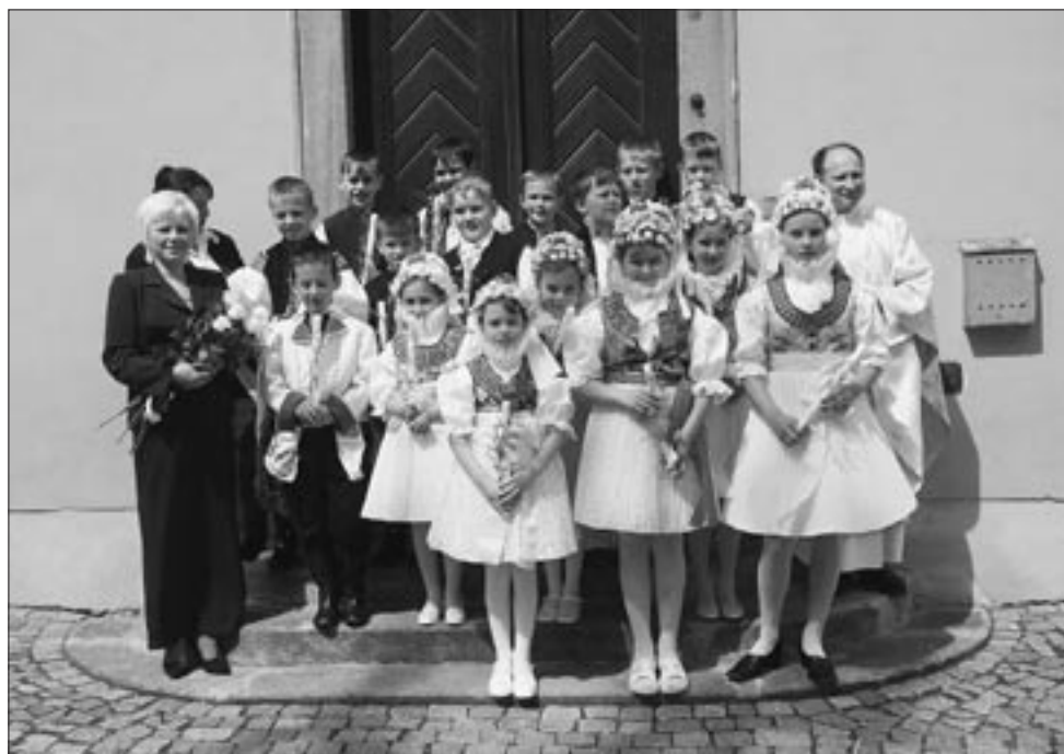
Svaté přijímání 13. června 2004