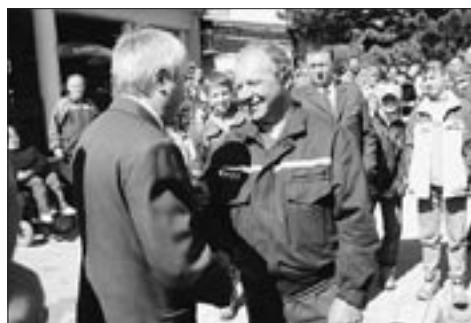
Velitel přebírá nové auto