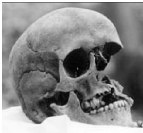
Nalezená lebka sv. Metoděje

tože když přišel poprvé na Moravu, představil se tamnímu lidu jako „Meffodej“, neboť ještě zcela dobře neuměl po moravsku vyslovovat. Lidé se jeho jména báli, připomínalo jim přezdívku ďábla Mefist, proto Metoděje nazývali Strachota. Měli z jeho jména strach). Církev tehdejší byla církví nepravou a tak byl pravý chřibský hrob Metodějův vykopán jezuiti. Tito ponechali v jámě pouze hrobový kámen a výkop pečlivě zasypali. Kam se kosterní ostatky a případné jiné předměty z hrobu dostaly, to zápis nevěděl. Naše expedice se však nevzdala.