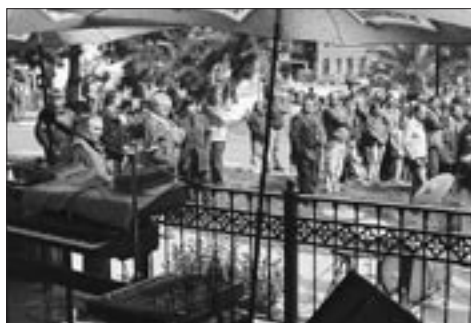
Vše sledovaly desítky diváků