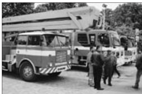
vystavená hasičská technika