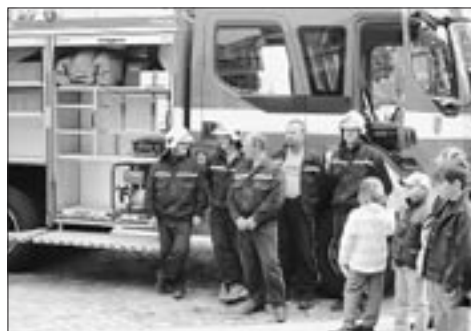
Buchlovická zásahová jednotka