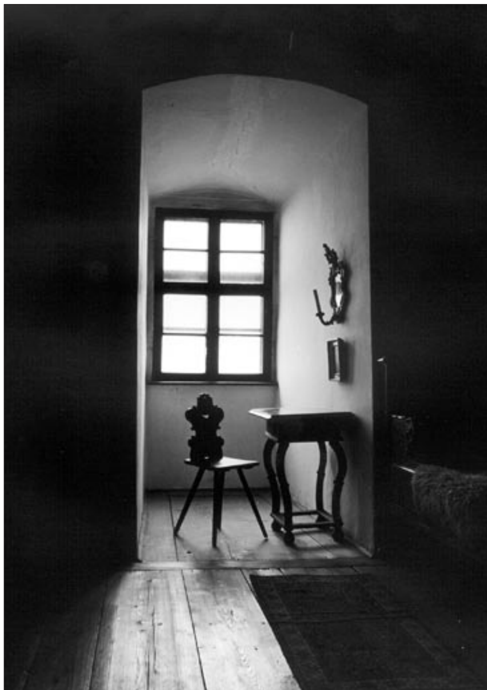
V západní věži hradu Buchlova