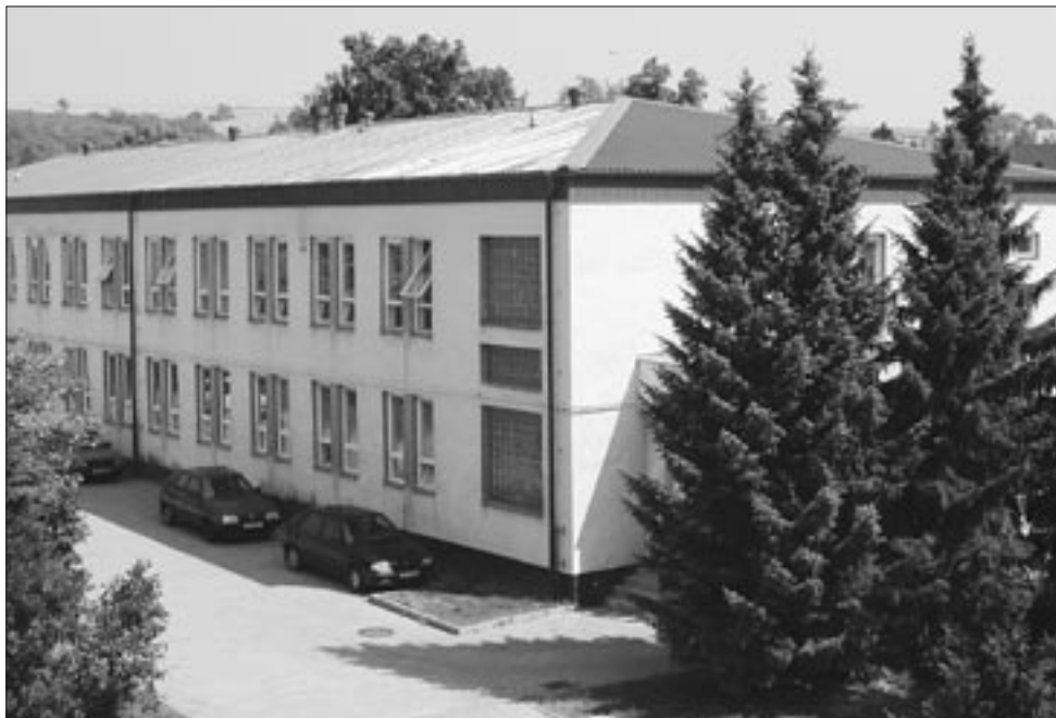
Před nedávnem přibyla na budovu obecního úřadu nová střecha