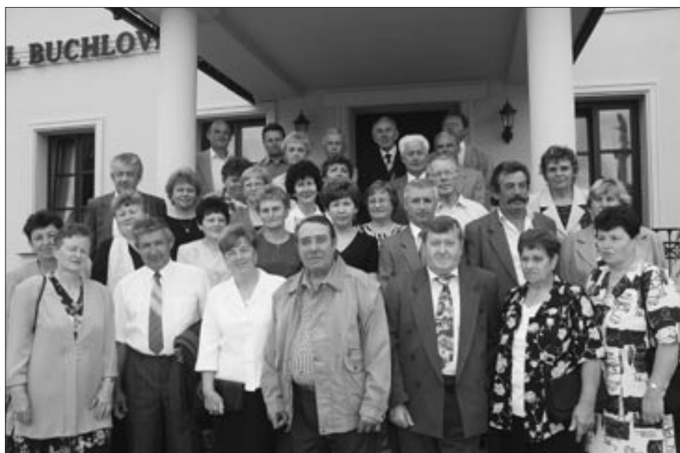
Setkání šedesátníků 19. června 2004