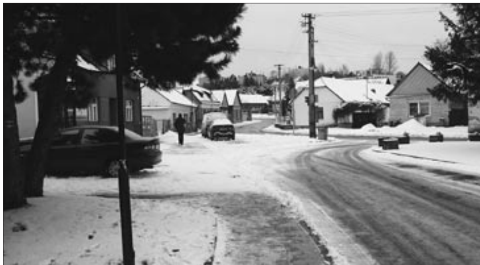
Koledníci letos procházeli zasněženými Buchlovicemi