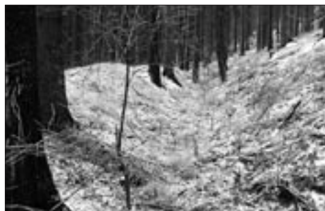
Hradská cesta spojující oba hrady