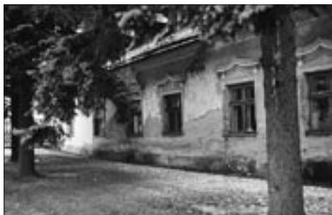
Zámek v Louče