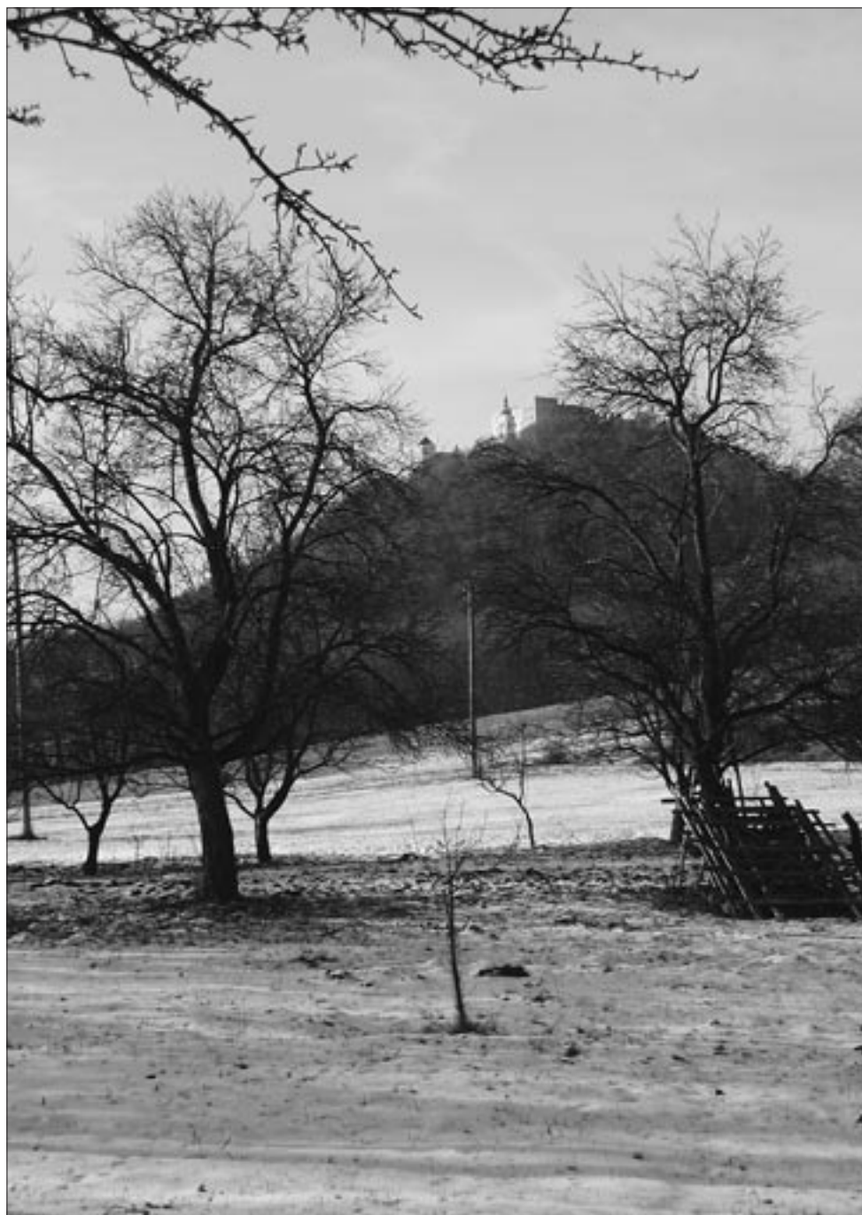
Zimní pohled na hrad Buchlov od Mikulčákového