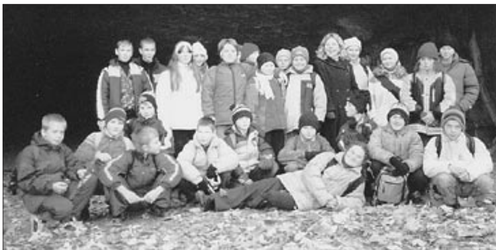
Členové kroužku před jeskyní Kůlna

Tato jeskyně získala své jméno údajně podle velké skalní desky nad vchodem. Pověst však vypráví, že v těchto místech tábořila za třicetileté války švédská vojska, obléhající blízké Brno, a vojáci stodovali na plochem kameni u vchodu do jeskyně. Ať tak či onak, v archeologickém světě je jeskyně Švédův stůl proslulá nálezem čelisti nejstaršího člověka v okolí Brna, člověka neandrtálského, lovce medvědů, který zde žil asi před 100 000 lety. Odborníci tu objevili i stopy dávných ohnišť a primitivní kamenné nástroje.