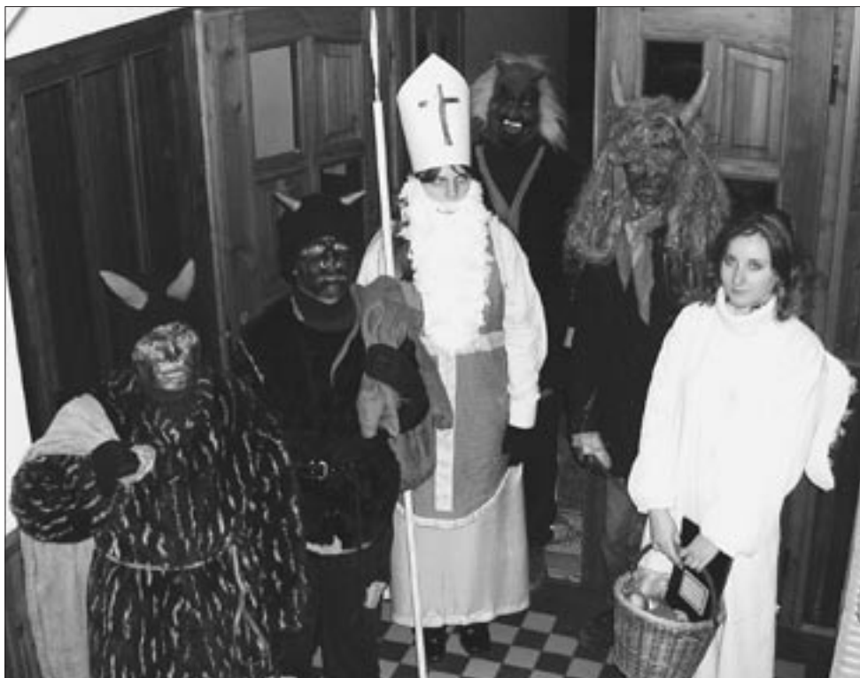
Na fotografii vidíte jednu z loňských Mikulášských skupin, která naháněla strach především zlobivým dětem v Buchlovicích.