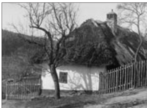
Na Salaši před osmdesáti lety

Dvojité CD Pověsti Uherského Hradiště a okolí zaujmou nejenom milovníky Uhersko-