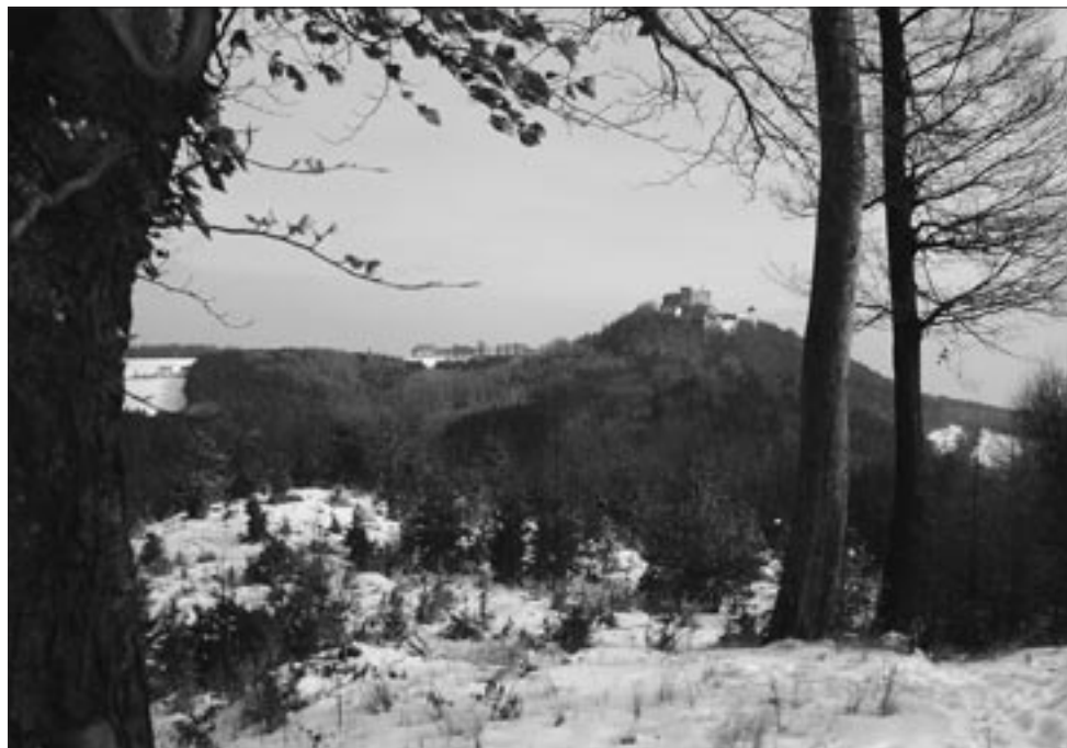
Hrad Buchlov z Holého kopce