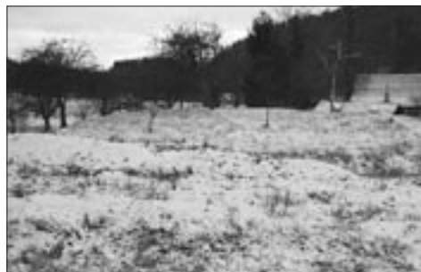
Zbytky rytířské tvrze v Podolí