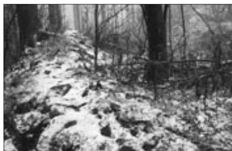
Rozvaliny Nového Šaumberku