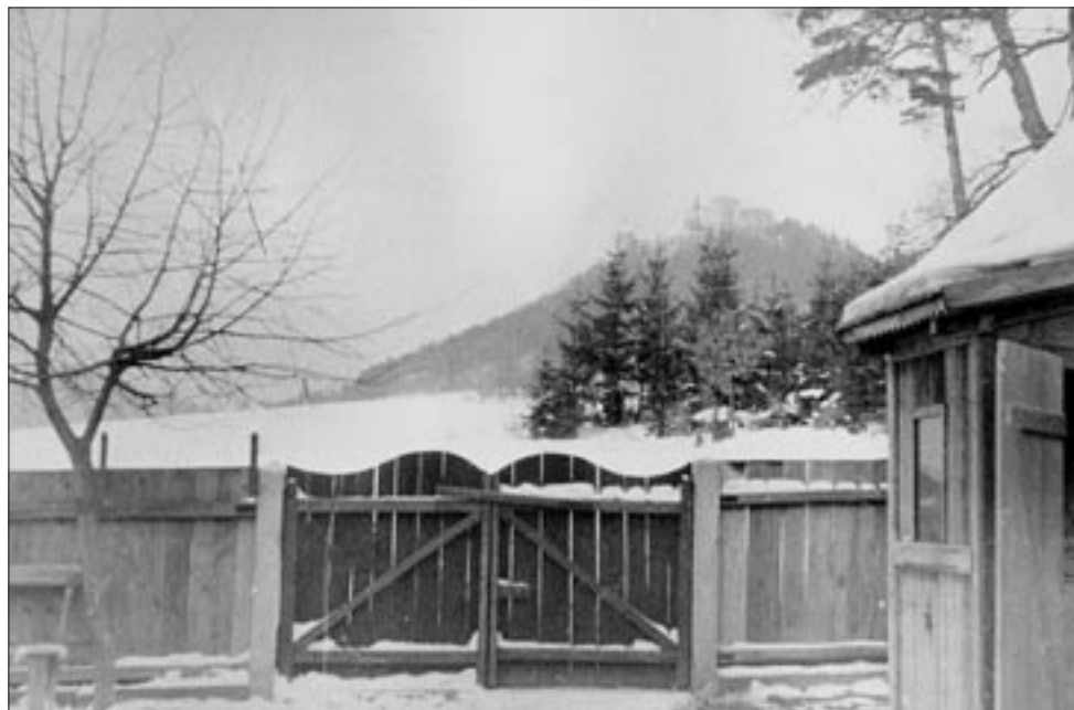
Pohled na Buchlov ze dvora chalupy pod Barborkou, kterou postavil na počátku dvacátých let 20. století hajný Jakub Procházka. Na fotografii dole následující majitel této chalupy Vavřinec Strýček (vpravo) se svou manželkou Boženou (vlevo) a její matkou – Procházkovou. Fota z dvacátých a třicátých let minulého století