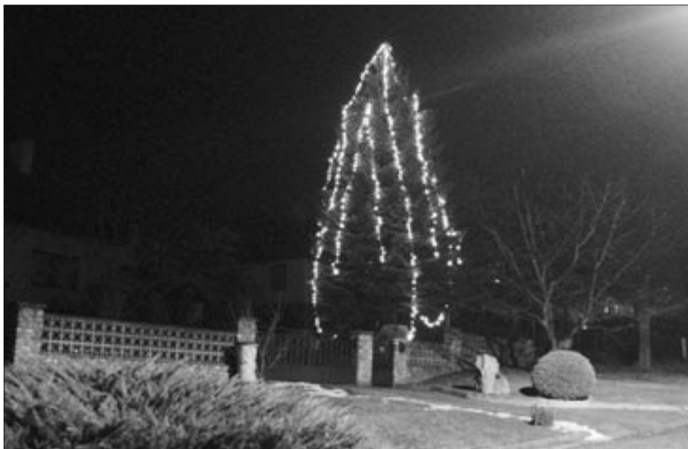
K našim Vánocům neodmyslitelně patří světlý ozářený stromček. Jeden z nejkrásnějších jsme letos našli na Lhotce.

Zvyk strojení vánočních stromčků se do Anglie rozšířil z kontinentu a byl přijat spolu s protestantskou vírou. K vánočnímu stromu se ve Velké Británii váže krásná legenda. Podle ní v horách přebývá dobrácký a štědrý vládce Vánoc. Vchod do jeho jeskyně hlídají trpaslíci. Je jich třiašedesát. Když nastanou Vánoce, vykřikne třiašedesátý trpaslík před vchodem do jeskyně: „Vánoce!“ a trpaslíci vyběhnou do lesů kácet jedle. Stromky slavnostně ozdobí a v žádném domě potom nemůže chybět vánoční stromček.