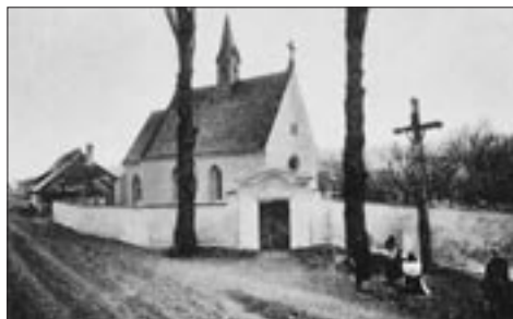
Kaple Cyrilka na Velehradě na fotografii z r. 1895

Z pověstí samotného města Uh. Hradiště uslyšíte příběhy týkající se Matyášovy brány či kaple sv. Šebestiána na Palackého náměstí. Další už vás