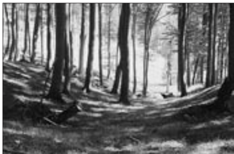
Staré lesy odedávna poskytovaly náměty k pověstem