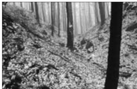
Příkop před hlavní bránou Starého Šaumberku