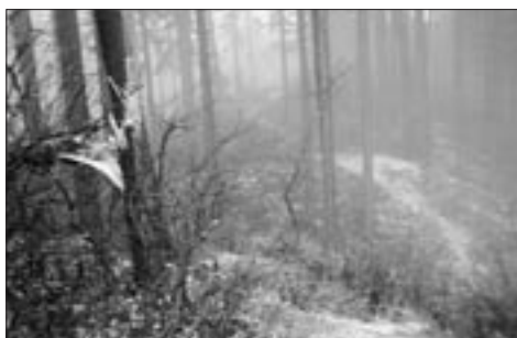
Střed Nového Šaumberku